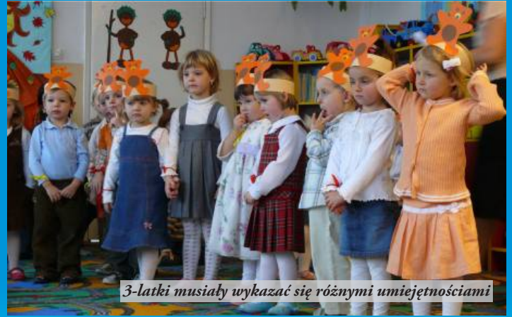
3-latki musiały wykazać się różnymi umiejętnościami