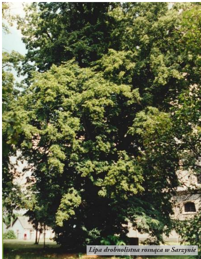
Lipa drobnolistna rosnąca w Sarzynie