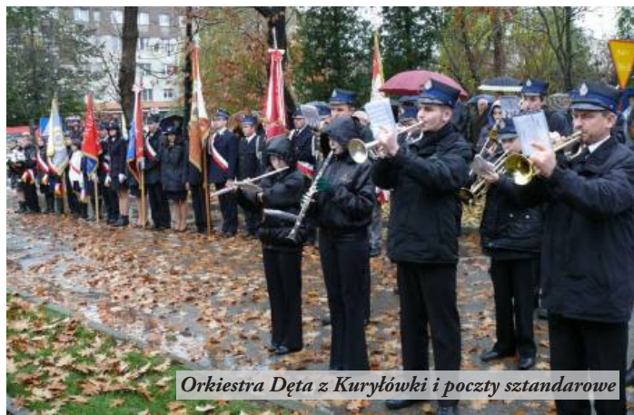
Orkiestra Dęta z Kuryłówki i poczty sztandarowe