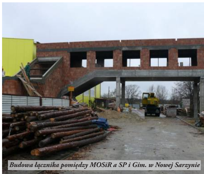
Budowa łącznika pomiędzy MOSiR a SP i Gim. w Nowej Sarzynie