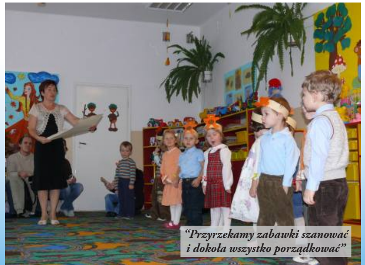
"Przyrzekamy zabawki szanować i dokoła wszystko porządkować"