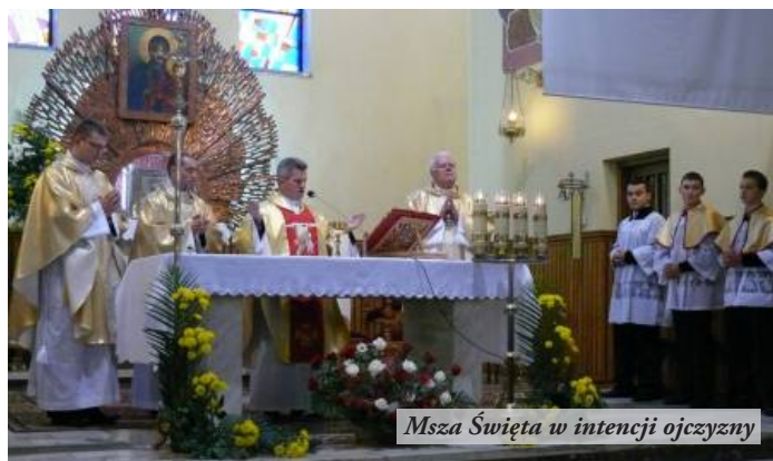
Msza Święta w intencji ojczyzny