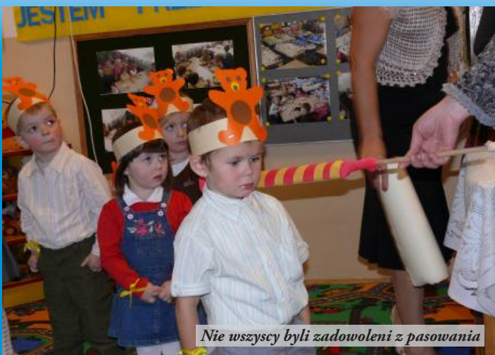
Nie wszyscy byli zadowoleni z pasowania