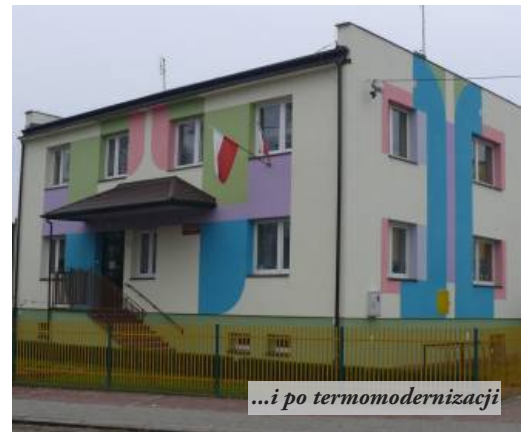
...i po termomodernizacji

oraz budynek urzędu miasta i gminy. Na tych obiektach został ocieplony strop i ściany zewnętrzne, wykonano tynk i malowanie elewacji,