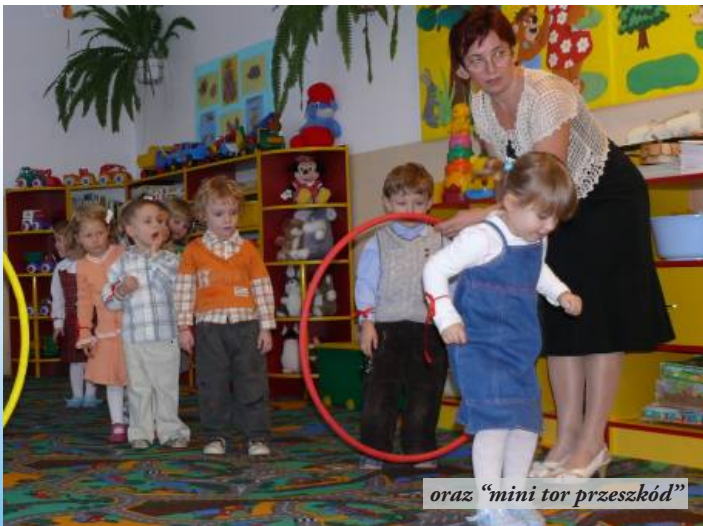
oraz "mini tor przeszkód"