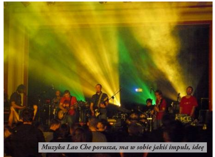
Muzyka Lao Che porusza, ma w sobie jakiś impuls, ideę

tańca i śpiewu. Nic dziwnego, bo muzyka Lao Che porusza, ma w sobie jakiś impuls, ideę, która nie ogranicza się jedynie do rozrywki, ale także wpływa na sferę duchową człowieka, pobudza jego wyobraźnię. Najlepszym tego dowodem są utwory, które zakończyły koncert w Ośrodku Kultury. Mowa tu o "Hydropieklówstąpieniu", opisującym jedną z biblijnych historii oraz piosence o prostym, acz treściwym tytule "Koniec".