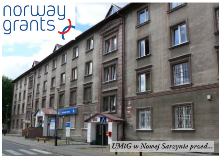
UMiG w Nowej Sarzynie przed...