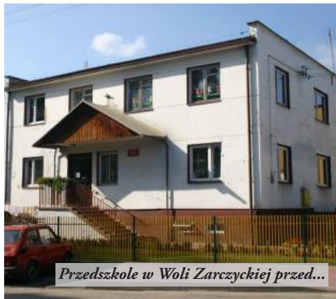
Przedszkole w Woli Zarczyckiej przed...