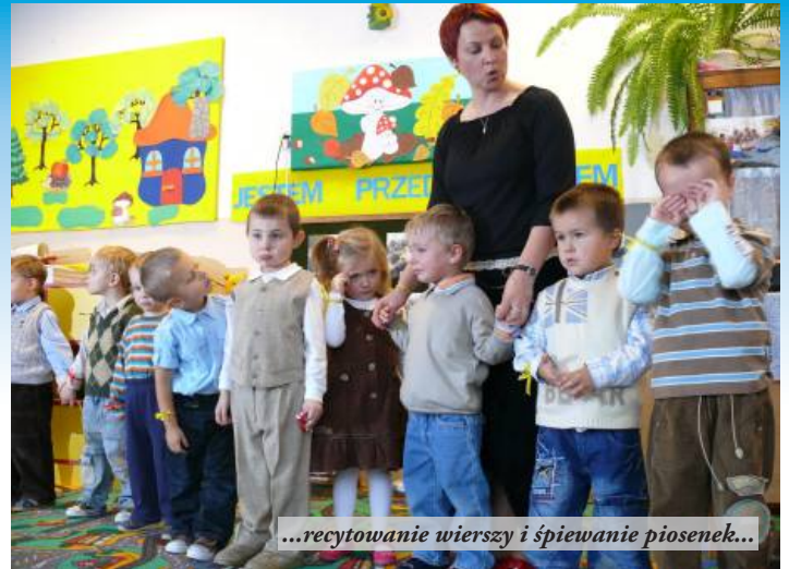
...recytowanie wierszy i śpiewanie piosenek...