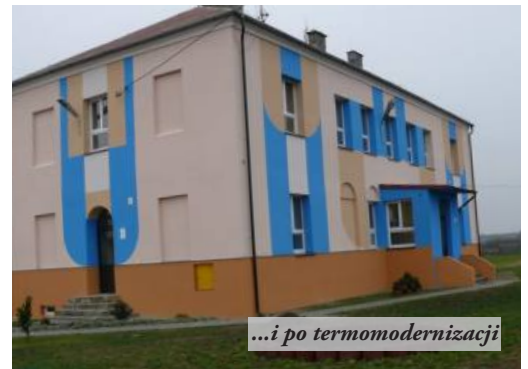
...i po termomodernizacji