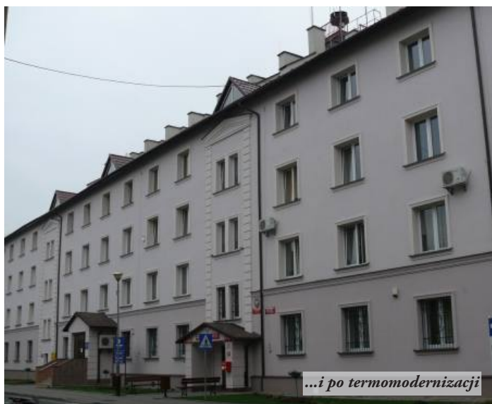
...i po termomodernizacji