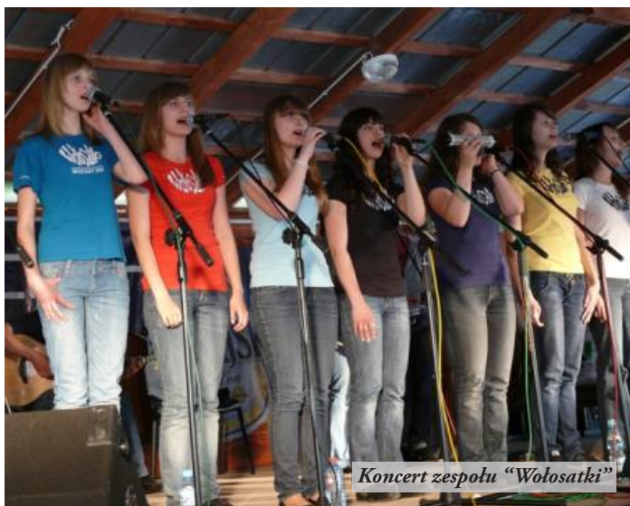
Koncert zespołu "Wołosatki"