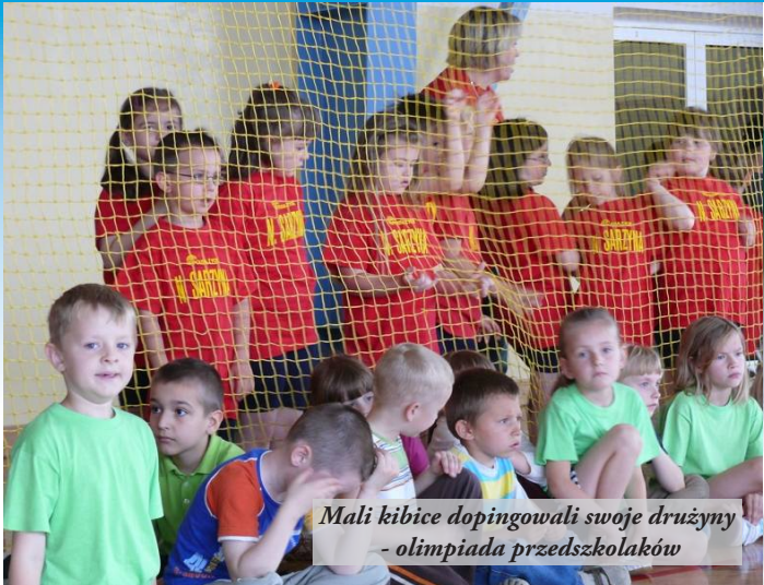
Mali kibice dopingowali swoje drużyny - olimpiada przedszkolaków