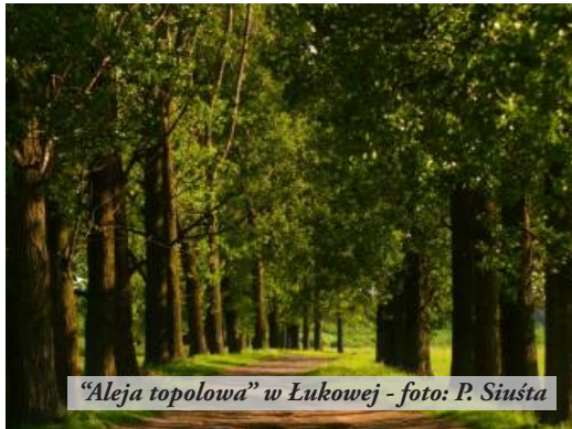
"Aleja topolowa" w Łukowej