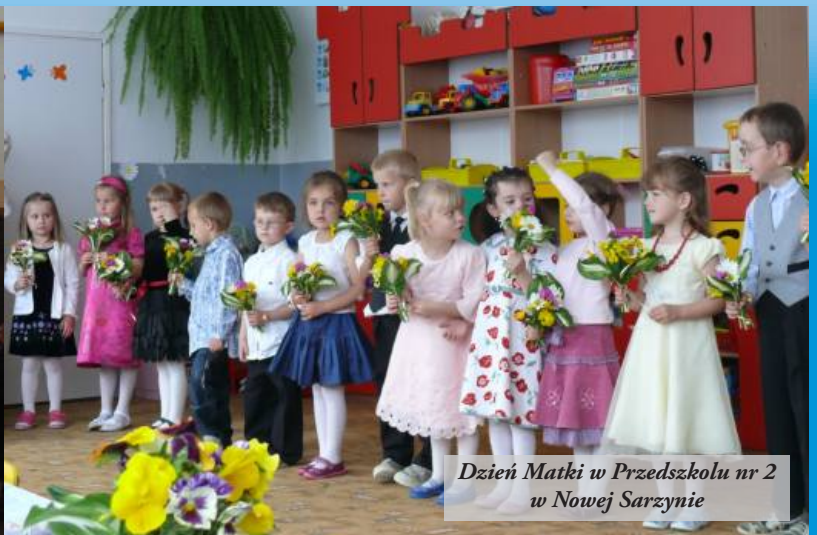
Dzień Matki w Przedszkolu nr 2 w Nowej Sarzynie