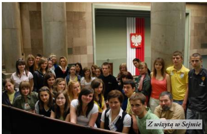
Z wizytą w Sejmie

Drugiego dnia głównym celem wycieczki stał się parlament, wyjątkowo cichy i spokojny w tym dniu, z uwagi na przerwę w obradach i obecność w stolicy wielu osobistości życia politycznego Europy, m.in. kanclerz Niemiec oraz premierów Francji, Włoch