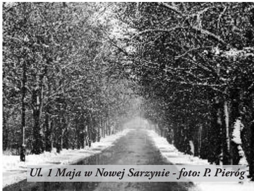
Ul. 1 Maja w Nowej Sarzynie