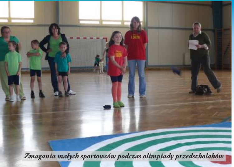
Zmagania małych sportowców podczas olimpiady przedszkolaków