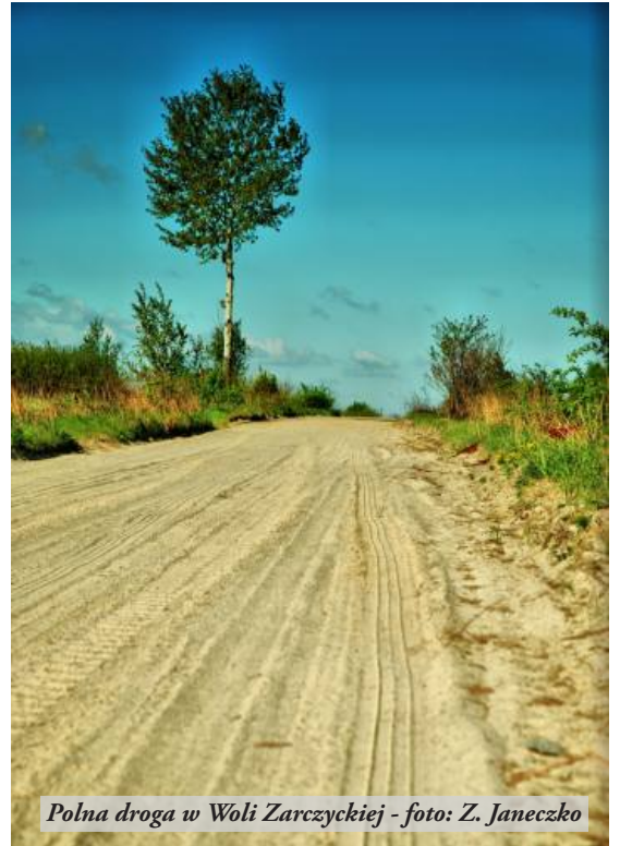
Polna droga w Woli Zarczyckiej