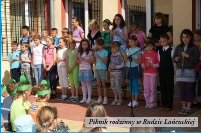
Piknik rodzinny w Rudzie Łańcuckiej