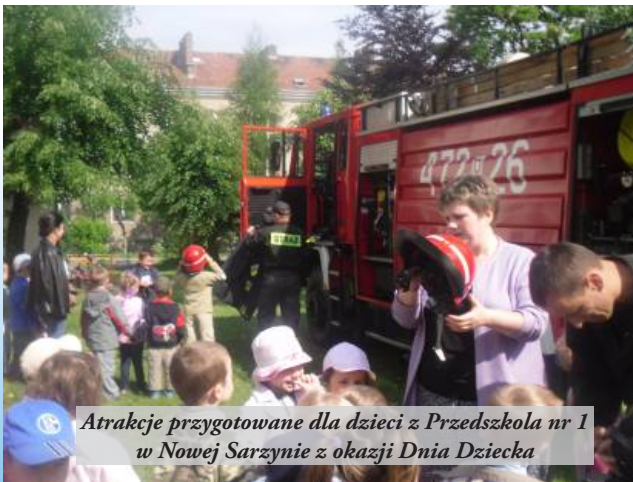
Atrakcje przygotowane dla dzieci z Przedszkola nr 1 w Nowej Sarzynie z okazji Dnia Dziecka