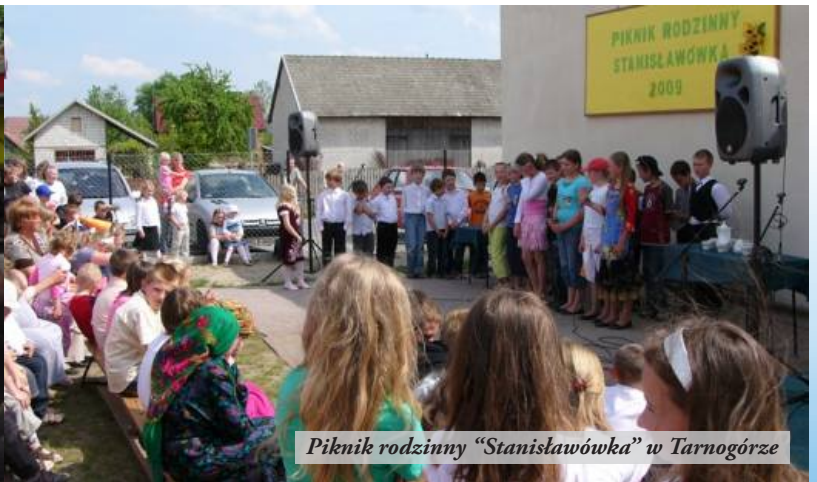
Piknik rodzinny "Stanisławówka" w Tarnogórze