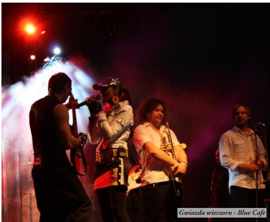
Gwiazda wieczoru - Blue Cafe