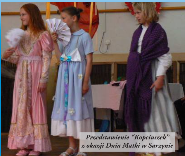
Przedstawienie "Kopciuszek" z okazji Dnia Matki w Sarzynie