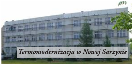
Termomodernizacja w Nowej Sarzynie

przedszkola w Nowej Sarzynie i Woli Zarczyckiej. Zakończyliśmy też szereg spraw związanych z przygotowaniem dokumentacji do przetargów.