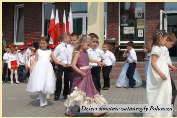
Dzieci świetnie zatańczyły Poloneza