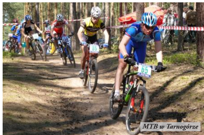
MTB w Tarnogórze