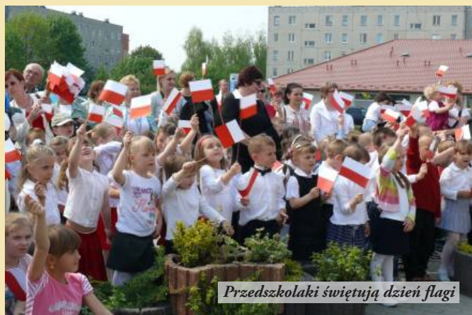
Przedszkolaki świętują dzień flagi