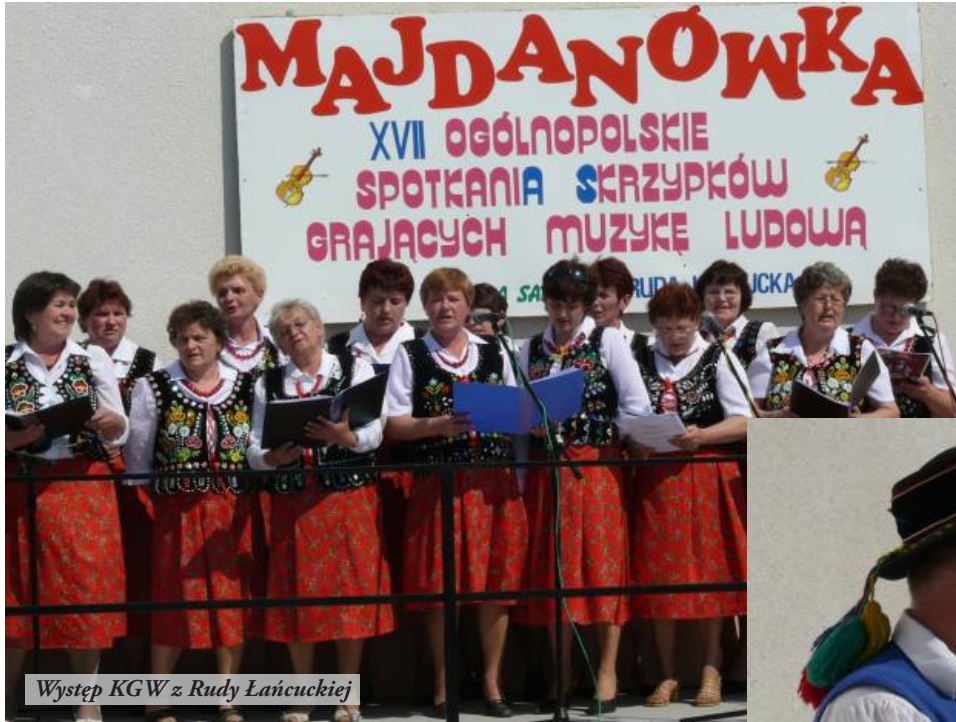
Występ KGW z Rudy Łańcuckiej