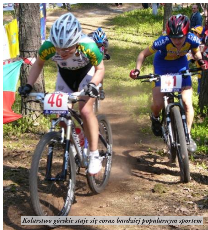
Kolarstwo górskie staje się coraz bardziej popularnym sportem