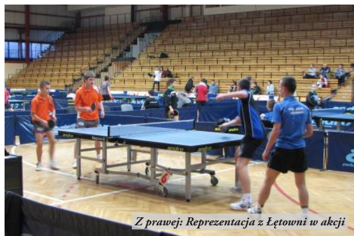
Z prawej: Reprezentacja z Łętowni w akcji