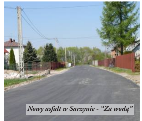
Nowy asfalt w Sarzynie - "Za wodą"