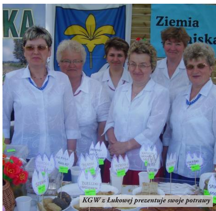
KGW z Łukowej prezentuje swoje potrawy