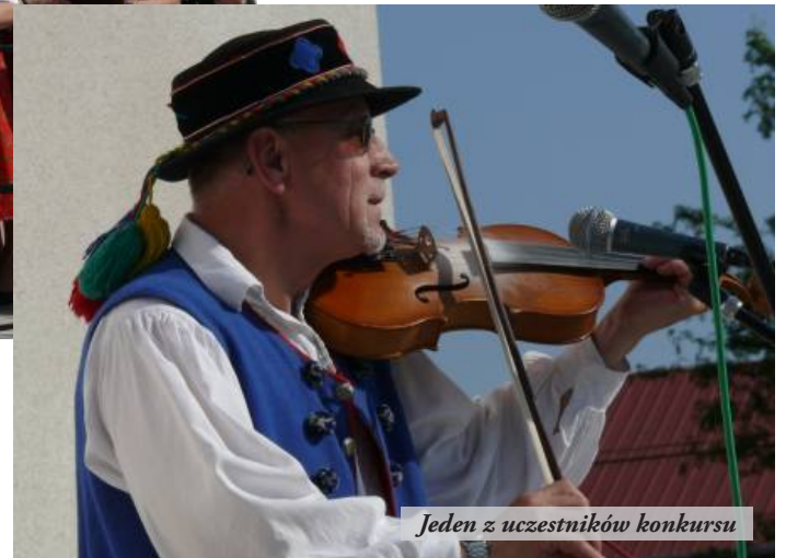
Jeden z uczestników konkursu