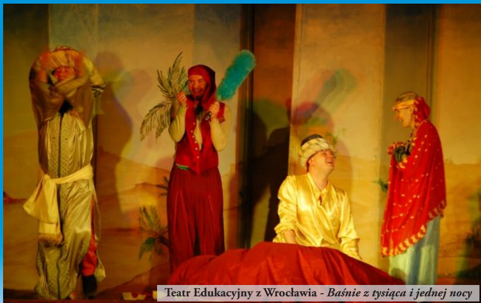
Teatr Edukacyjny z Wrocławia - Baśnie z tysiąca i jednej nocy