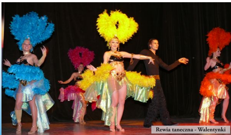
Rewia taneczna - Walentynki