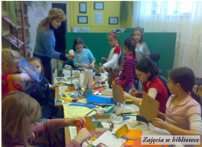
Zajęcia w bibliotece

Podczas ferii zimowych w Miejskiej i Gminnej Bibliotece Publicznej w Nowej Sarzynie odbywały się zajęcia dla uczniów z młodszych klas szkoły podstawowej, podczas których dzieci wykonywały m.in. ramkę do ulubionej fotografii i kartkę walentynkową. Przy pomocy niekonwencjonalnych materiałów próbowały również oddać nastrój zimy. Płatki ryżowe musiały zastąpić płatki śniegu, którego jak zwykle na feriach nie było. Głównym elementem każdego spotkania było jednak, jak na bibliotekę przystało, głośne czytanie bajek. Prace plastyczne można jeszcze podziwiać na wystawie w MiG BP.