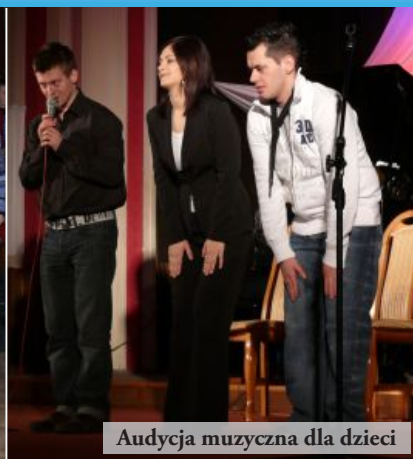
Audycja muzyczna dla dzieci