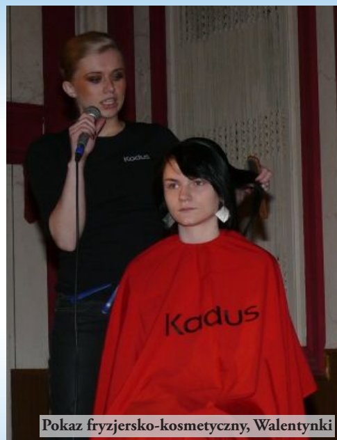
Pokaz fryzjersko-kosmetyczny, Walentynki