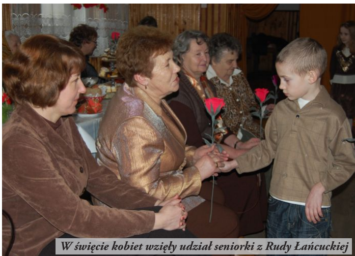
W święcie kobiet wzięły udział seniorki z Rudy Łańcuckiej

Wydawać by się mogło, że Koła Gospodyń Wiejskich to relikty przeszłości. Nic bardziej mylnego. W powiecie leżajskim ich liczba wciąż rośnie. Dwadzieścia gospodyń z Rudy Łańcuckiej zdecydowało się wspólnie działać. Na swoim koncie mają już dwie imprezy integracyjne, a działają zaledwie od dwóch miesięcy. Pierwszą z nich była lutowa biesiada, w której wzięli udział samorządowcy oraz miejscowi przedsiębiorcy. Kolejną - Dzień Kobiet, na który zaproszono seniorki.