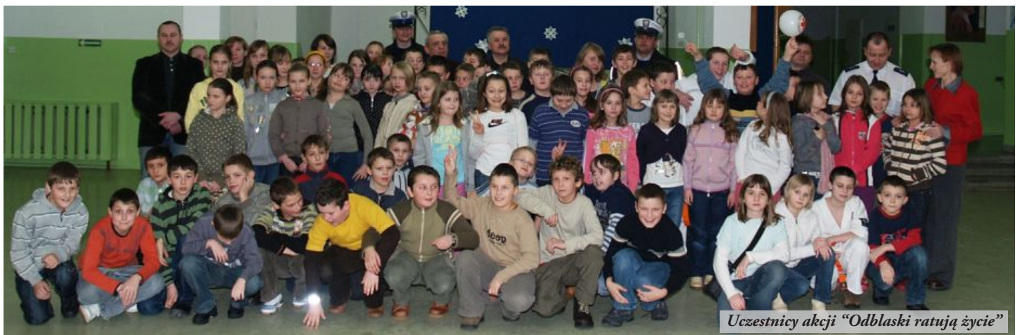
Uczestnicy akcji "Odblaski ratują życie"