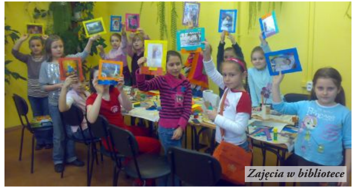
Zajęcia w bibliotece

W Filii w Ośrodku Kultury w Nowej Sarzynie uczestnicy zajęć wyszukiwali w książkach i Internecie rymowanek i wierszyków o bibliotece i o zimie. Wykonali też wspólnie plakat promujący bibliotekę, który wisi na honorowym miejscu. Filia w Jelnej zaferowała dzieciom głośne czytanie baśni wraz ze sprawdzianem zapamiętywania ich treści oraz wykonywanie kwiatów z papieru i bibuły. W Sarzynie, w czasie ferii odbywały się próby do przedstawienia "Kopciuszek", które wystawione zostanie przy współpracy z Domem Kultury, przez kółko teatralne, działające od niedawna w bibliotece. W Tarnogórze młodzi czytelnicy głośno czytali swym kolegom i koleżankom baśnie. Gry planszowe, a także odgadywanie tytułów bajek ze scenek odgrywanych przez dzieci i ilustracji zaproponowała Filia w Łętowni.