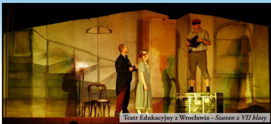
Teatr Edukacyjny z Wrocławia - Szatan z VII klasy