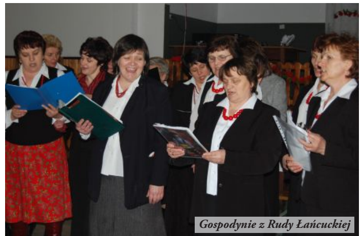
Gospodynie z Rudy Łańcuckiej

Jak dodaje gospodyni, najważniejszym celem koła jest integracja wsi. Już w maju, na świętego Floriana chcemy razem ze strażakami zorganizować piknik rodzinny. Myślimy o pokazach strażackich i policyjnych - zdradza Waławska.