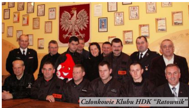
Członkowie Klubu HDK „Ratownik”