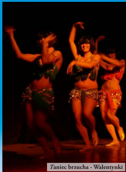
Taniec brzucha - Walentynki