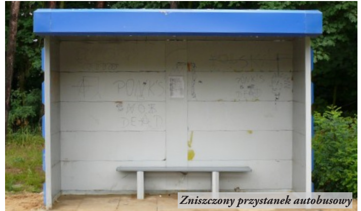
Zniszczony przystanek autobusowy