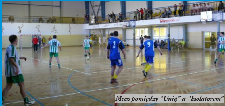
Mecz pomiędzy "Unią" a "Izolatorem"