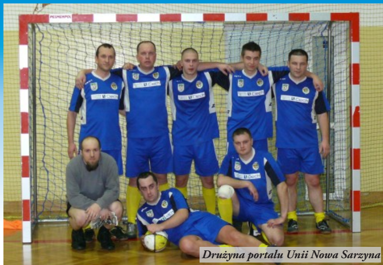
Drużyna portalu Unii Nowa Sarzyna