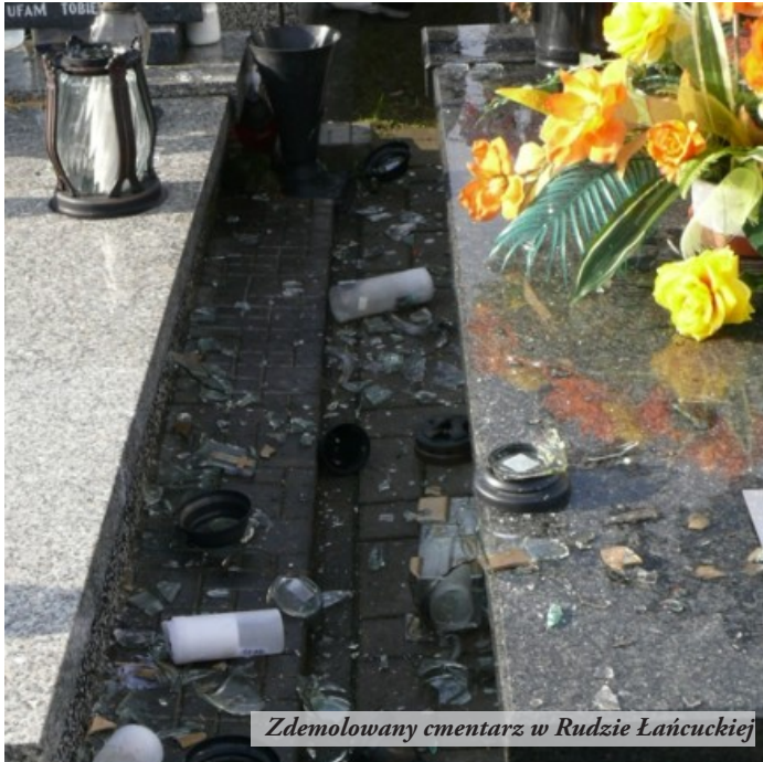
Zdemolowany cmentarz w Rudzie Łańcuckiej

Jednocześnie informuję, że wandalizm, tj. umyślne uszkodzenie lub zniszczenie mienia w tym społecznego jest karalne w trybie postępowania w sprawach o wykroczenie (wykroczenie z art. 124 Kodeksu Wykroczeń). W przypadku, jeżeli wartość szkody przekracza kwotę 250 zł, wandalizm jest przestępstwem określonym w art. 288 Kodeksu Karnego, a czyn ten podlega karze pozbawienia wolności od 3 miesięcy do 5 lat.