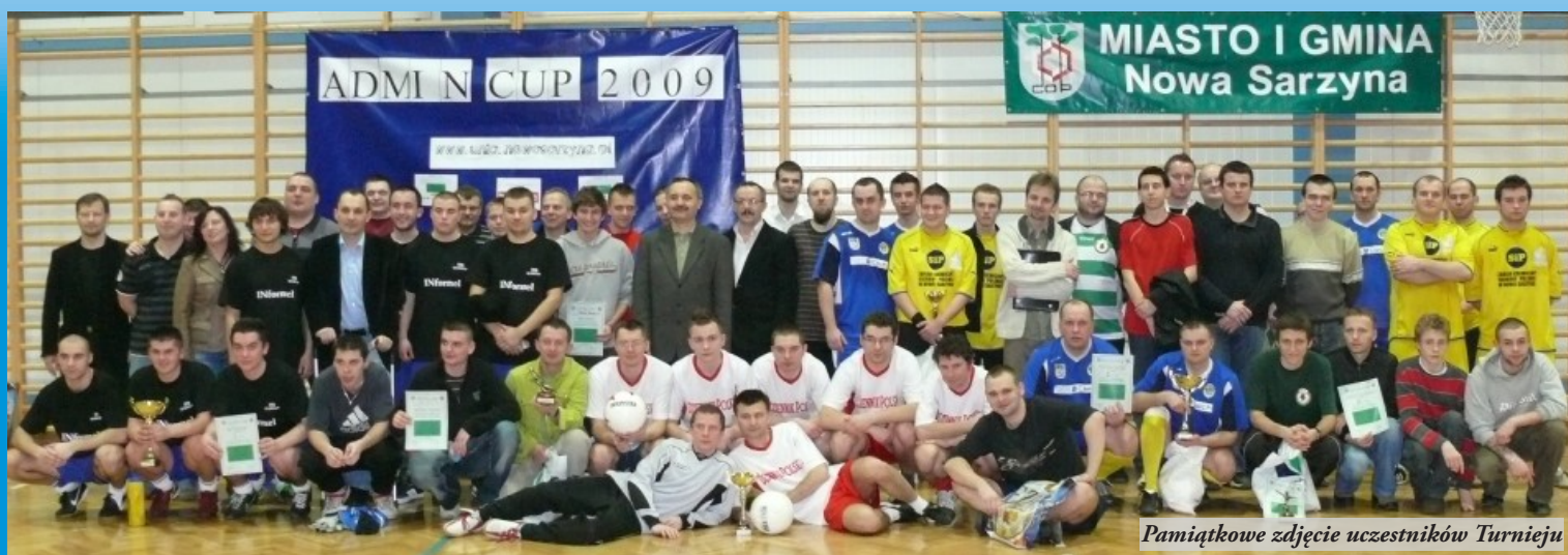
Pamiątkowe zdjęcie uczestników Turnieju