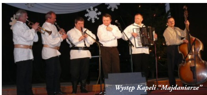
Występ Kapeli „Majdaniarze”