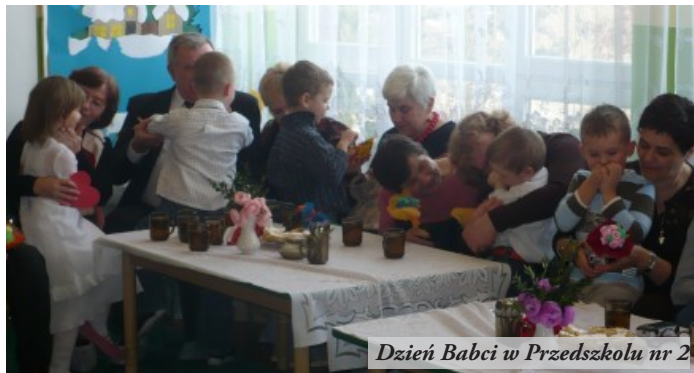
Dzień Babci w Przedszkolu nr 2

Dzień Babci i Dzień Dziadka są szczególnymi w ciągu roku – dniami przeznaczonymi na pielęgnowanie rodzinnych więzi, ale również na zwrócenie uwagi na potrzeby seniorów. Warto zadbać o to, aby niezależnie od sytuacji rodzinnej, stały się one czasem poświęconym na refleksje na temat relacji pomiędzy dziadkami a wnukami. W tych dniach szczególnie istotny staje się fakt