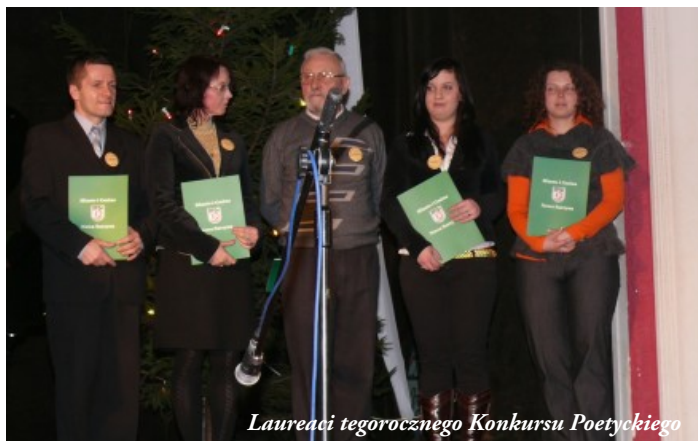
Laureaci tegorocznego Konkursu Poetyckiego