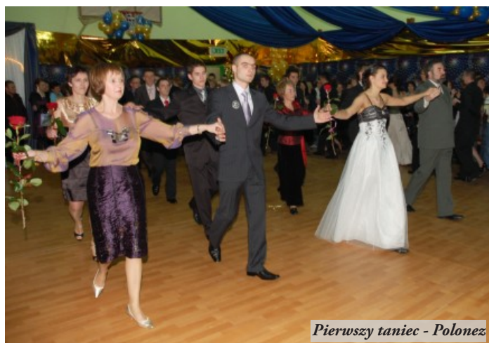
Pierwszy taniec - Polonez