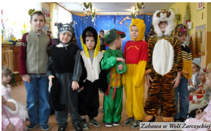
Zabawa w Woli Żarczyckiej

Tekst i foto: Lucyna Lizak, Barbara Mścisz