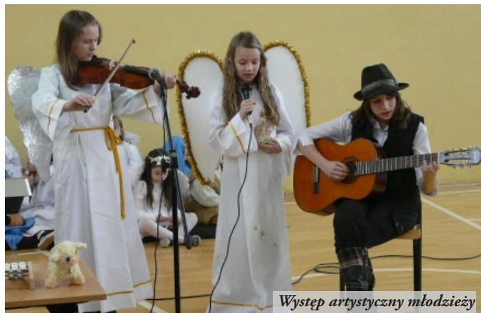
Występ artystyczny młodzieży

W dniach 22 i 23 stycznia 2009 roku, w Szkole Podstawowej w Łętowni odbyła się druga edycja konkursu kolęd i pastorałek pt. "Anielskie Śpiewogranie". Zgłosiło się do niej 23 solistów i 6 zespołów, w tym po raz pierwszy przedszkolaki. Każdy z uczestników, we wspaniałym kostiumie prezentował swoje umiejętności wokalne,