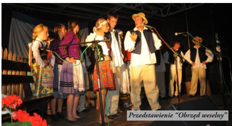
Przedstawienie "Obrzęd weselny"