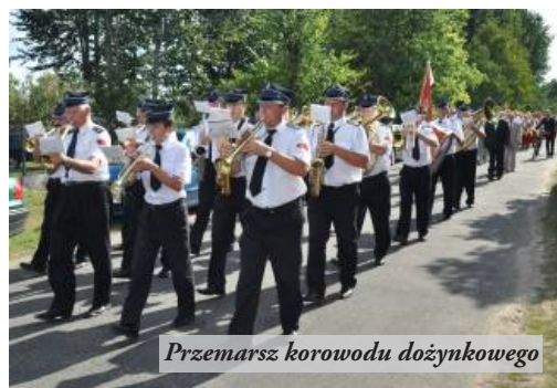
Przemarsz korowodu dożynkowego