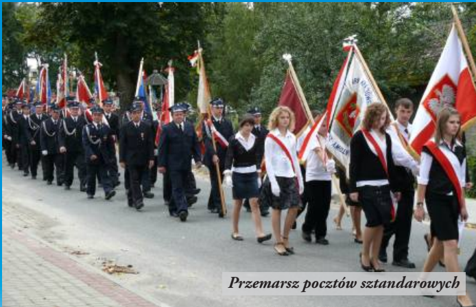
Przemarsz pocztów sztandarowych