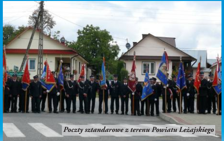
Poczty sztandarowe z terenu Powiatu Leżajskiego