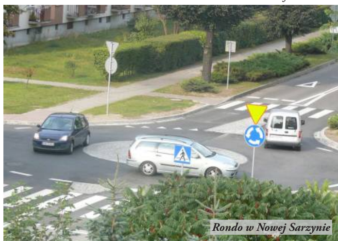
Rondo w Nowej Sarzynie