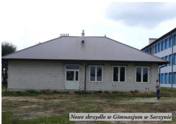
Nowe skrzydło w Gimnazjum w Sarzynie