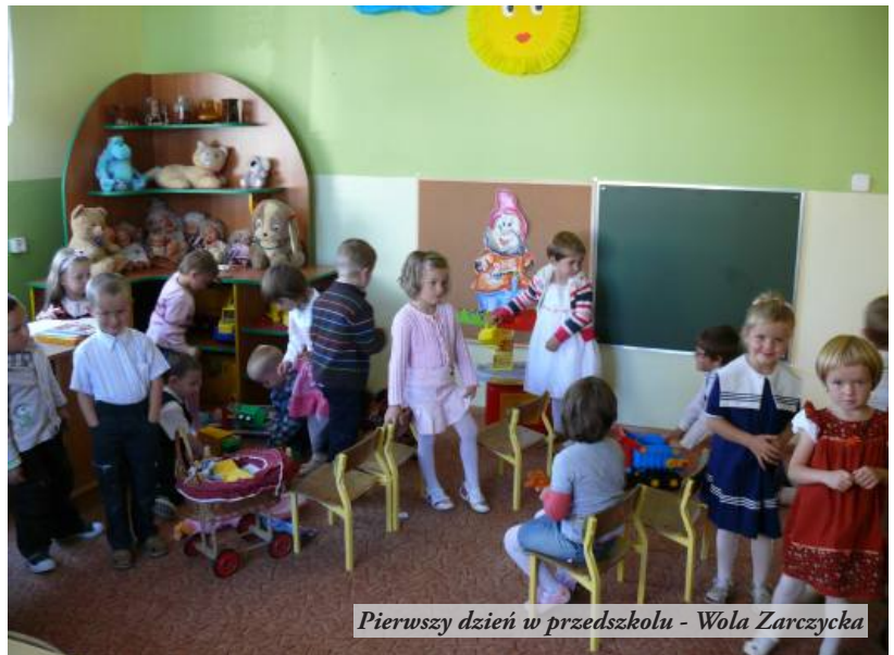
Pierwszy dzień w przedszkolu - Wola Zarczycka