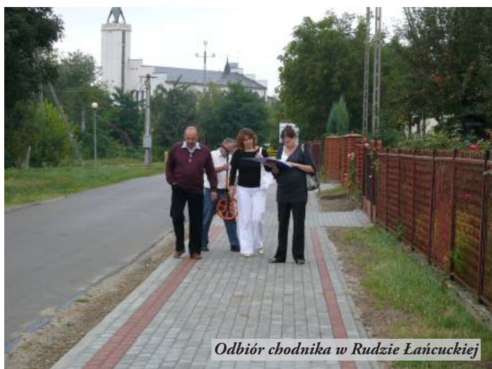
Odbiór chodnika w Rudzie Łańcuckiej

7 września 2009 r. został oddany do użytku nowy chodnik w Rudzie Łańcuckiej, od drogi powiatowej w stronę kościoła, o długości prawie 500 m. Inwestycja kosztowała 149 tys. złotych.