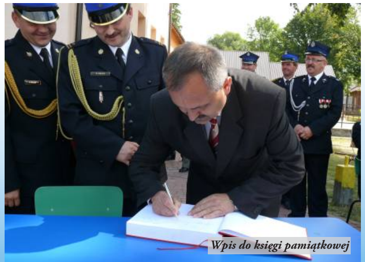
Wpis do książki pamiątkowej