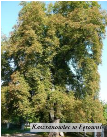
Kasztanowiec w Łętowni

Największą atrakcją przyrodniczą naszej gminy jest, powszechnie znany, Rezerwat Przyrody "Kołacznia". Chroni on jedyne naturalne stanowisko różanecznika złotego w Polsce. Nie wszyscy jednak wiedzą, że oprócz azalii mamy także kilka starych drzew – objętych ochroną prawną pomników przyrody oraz wiele ciekawych gatunków roślin. Rozpoczynamy nowy cykl, w którym będziemy je Państwu przybliżać.