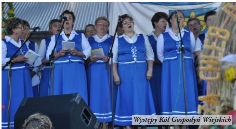
Występy Kół Gospodyń Wiejskich