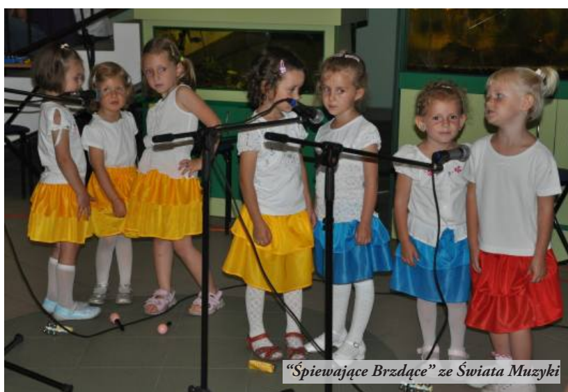
"Śpiewające Brzdące" ze Świata Muzyki