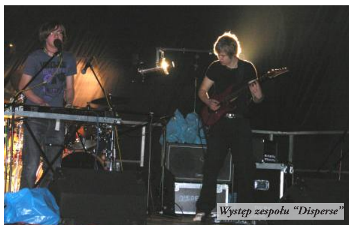
Występ zespołu "Disperse"

W czasie imprezy publiczność mogła obejrzeć występ dzieci z ogniska muzycznego "Świat muzyki" oraz spektakl o tematyce ekologicznej "Historia zaginionego papierka" w wykonaniu Krakowskiego Biura Promocji Kultury.