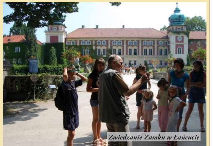
Zwiedzanie Zamku w Łańcucie