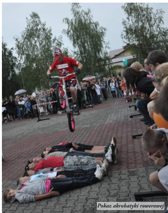
Pokaz akrobatyki rowerowej