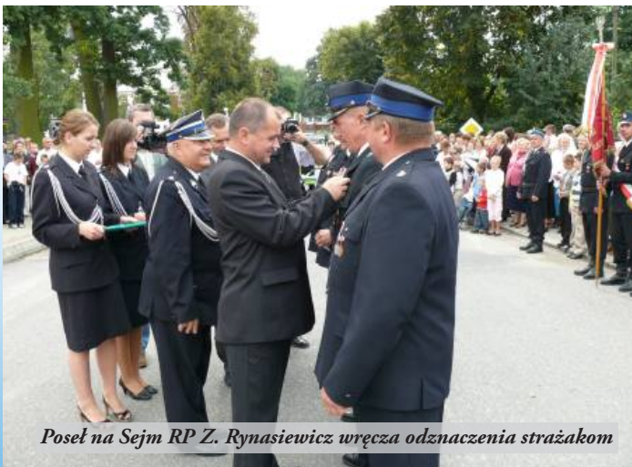
Poseł na Sejm RP Z. Rynasiewicz wręcza odznaczenia strażakom