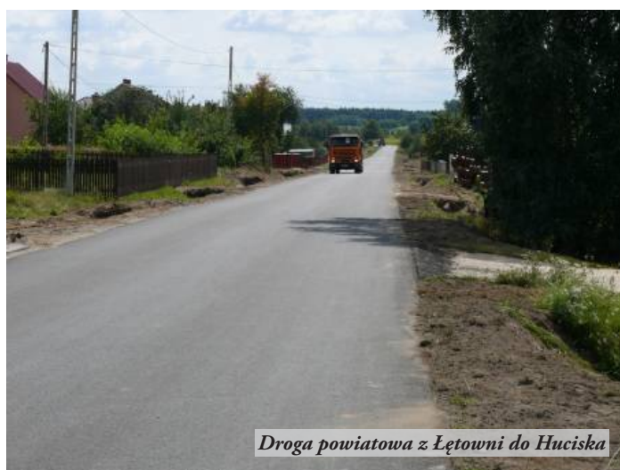
Droga powiatowa z Łętowni do Huciska

Miasto i Gmina Nowa Sarzyna dofinansowało kwotą 406 tys. zł przebudowę drogi powiatowej z Łętowni do Huciska. Dzięki staraniom Gminy, GDDKiA wykonała dwa aktywne przejścia dla pieszych na drodze krajowej nr 77 w Nowej Sarzynie.