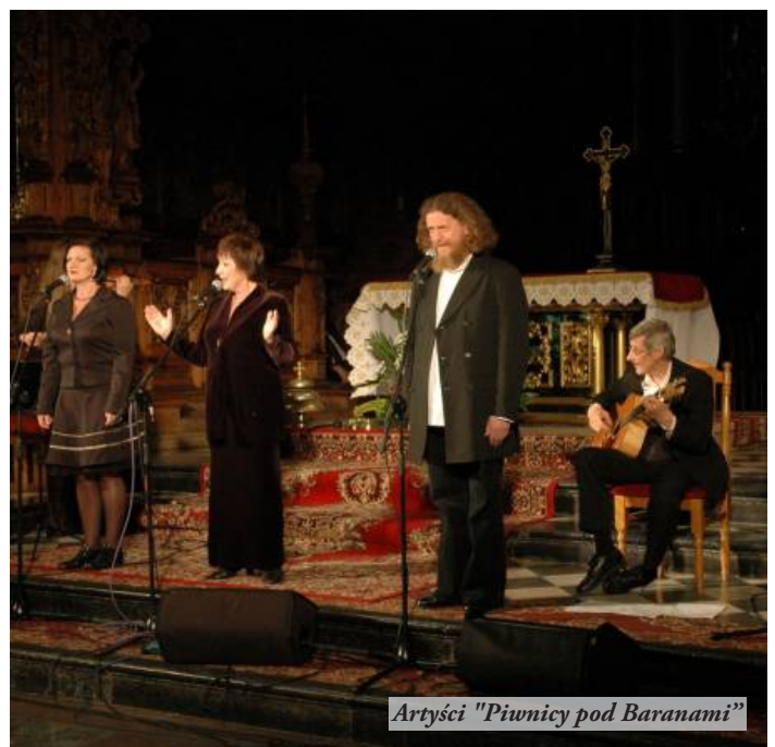
Artyści "Piwnicy pod Baranami"