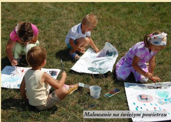
Malowanie na świeżym powietrzu

tekst: bw na podst. informacji Agaty Bogdan, foto: Beata Łoin