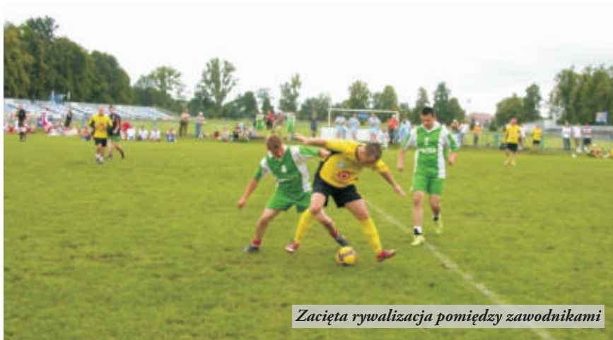
Zacięta rywalizacja pomiędzy zawodnikami

W półfinałach zmierzyły się WSK Rzeszów – Zelmer (3:1), Nowa Sarzyna - Żołyńia (0:0/7:6 w rzutach karnych). Wyniki meczów finałowych Zelmer - Żołyńia 2:1, Nowa Sarzyna - WSK Rzeszów 0:2.