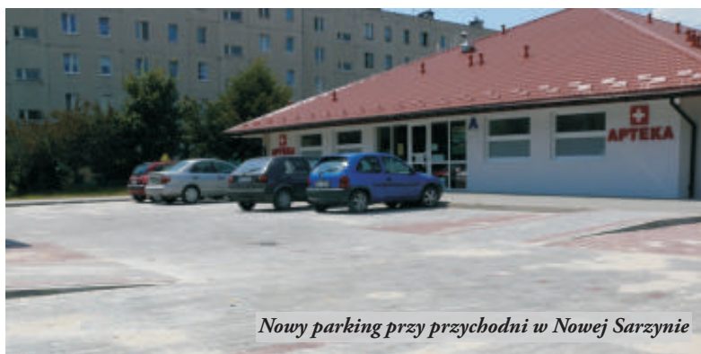
Nowy parking przy przychodni w Nowej Sarzynie