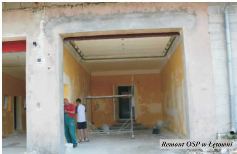
Remont OSP w Łętowni