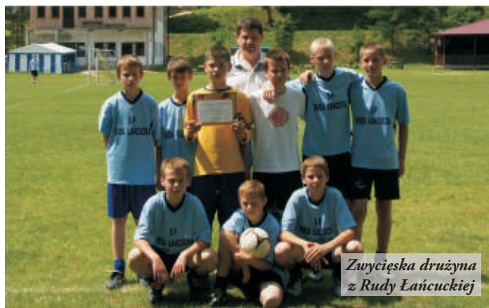
Zwycięska drużyna z Rudy Łańcuckiej