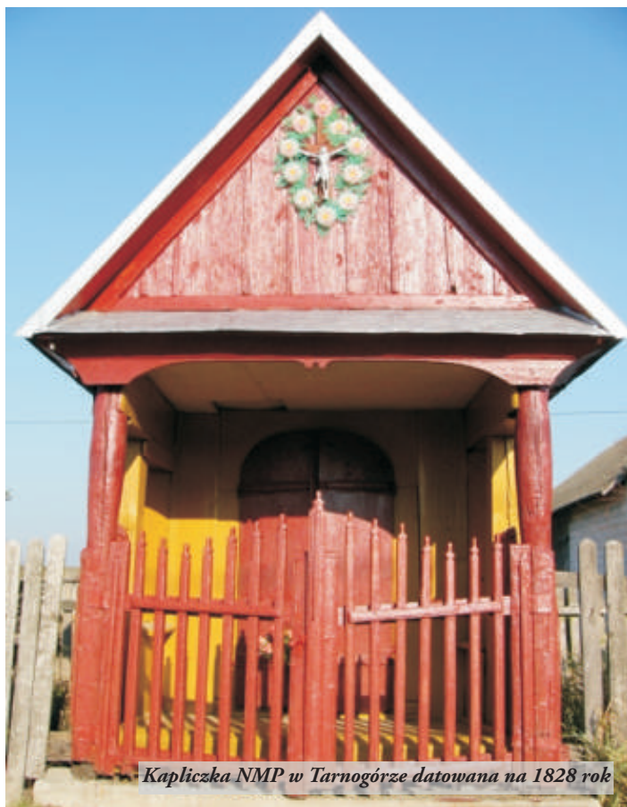
Kapliczka NMP w Tarnogórze datowana na 1828 rok