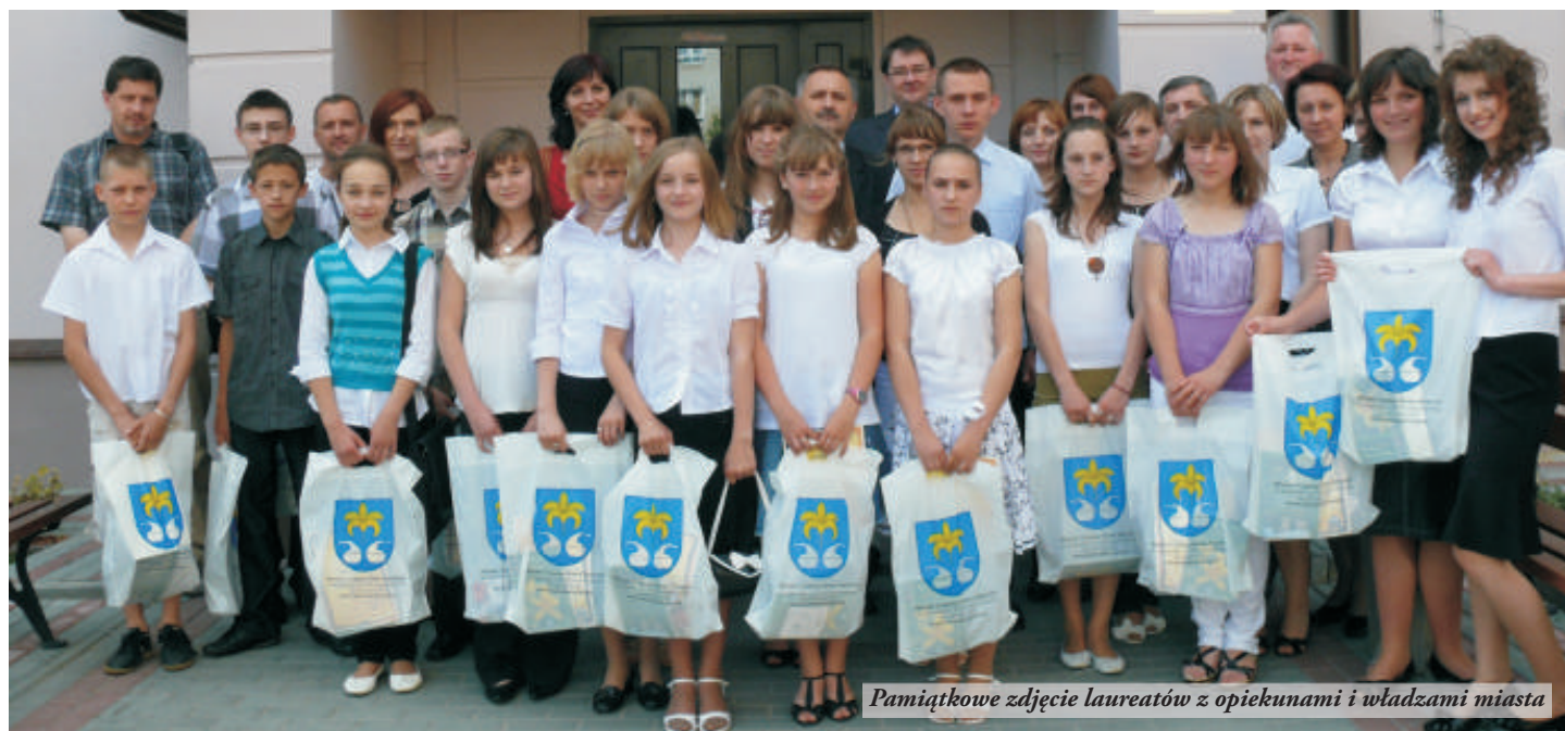
Pamiątkowe zdjęcie laureatów z opiekunami i władzami miasta