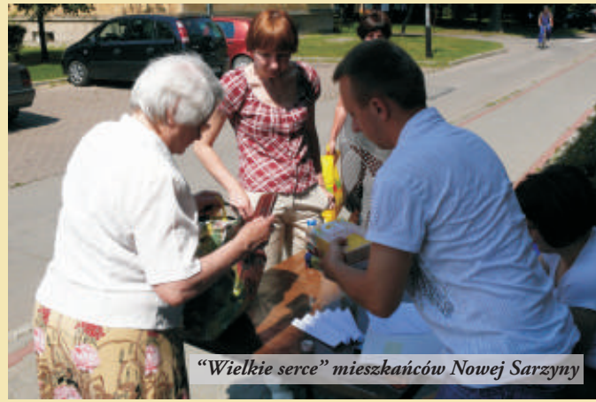
"Wielkie serce" mieszkańców Nowej Sarzyny