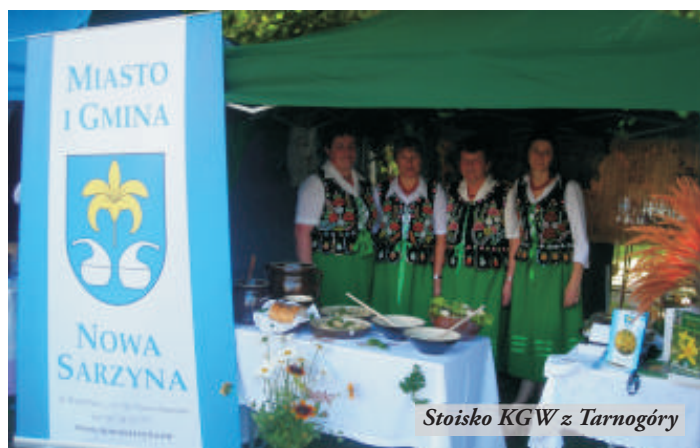
Stoisko KGW z Tarnogóry