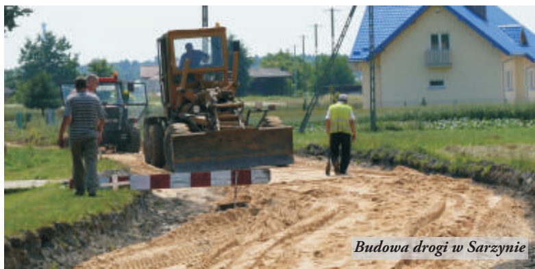
Budowa drogi w Sarzynie