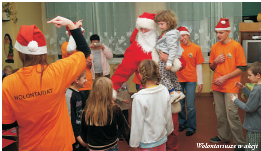
Wolontariusze w akcji

Jeśli chcesz być szczęśliwy przez godzinę - utnij sobie drzemkę Jeśli chcesz być szczęśliwy przez dzień - idź na ryby Jeśli chcesz być szczęśliwy przez miesiąc - ożeń się Jeśli chcesz być szczęśliwy przez rok - odziedzicz fortunę Jeśli chcesz być szczęśliwy przez całe życie - pomagaj innym w pasją (stare chińskie przysłowie)