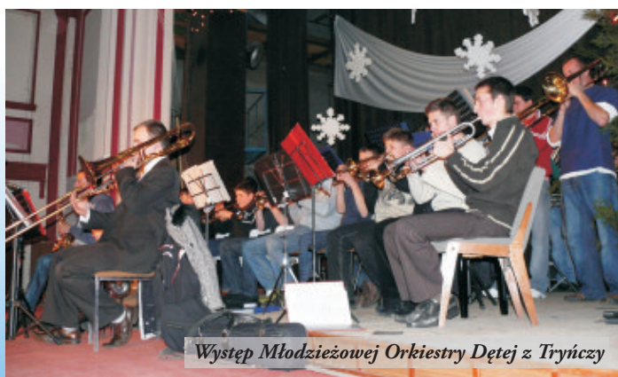
Występ Młodzieżowej Orkiestry Dętej z Trynicy