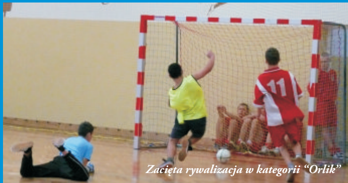
Zacięta rywalizacja w kategorii "Orlik"