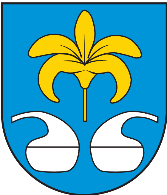
Herb Miasta i Gminy Nowa Sarzyna

W polu błękitnym kwiat azalii pontyjskiej złoty, nad dwiema retortami wypełnionymi substancją chemiczną w pas, srebrne.