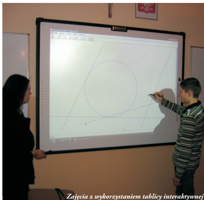
Zajęcia z wykorzystaniem tablicy interaktywnej