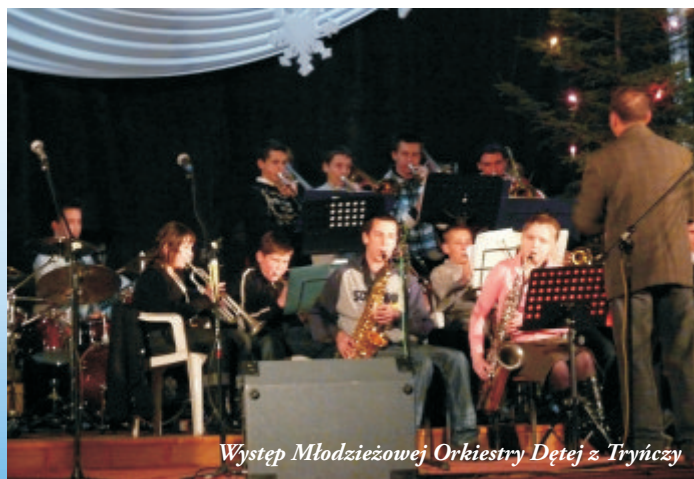
Występ Młodzieżowej Orkiestry Dętej z Trynicy