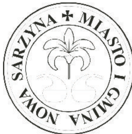
Pieczęć Miasta i Gminy Nowa Sarzyna