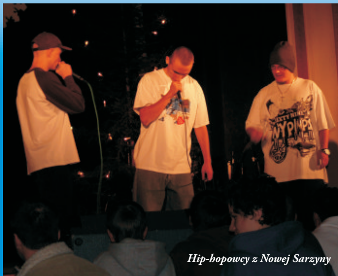
Hip-hopowcy z Nowej Sarzyny