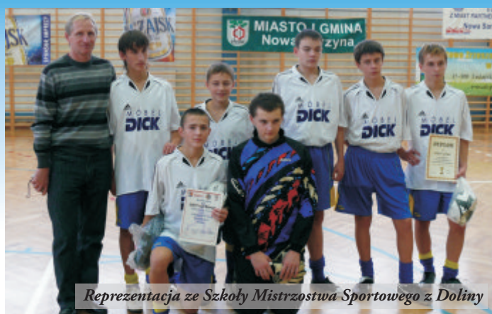
Reprezentacja ze Szkoły Mistrzostwa Sportowego z Doliny