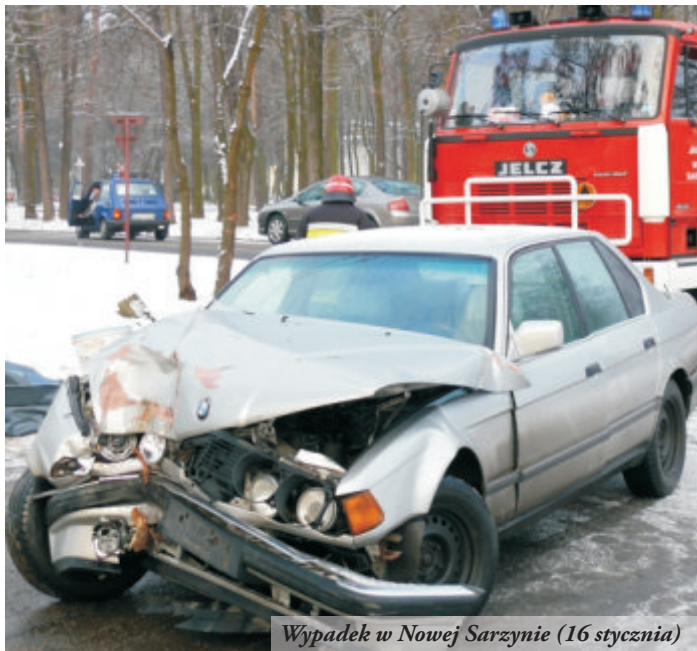
Wypadek w Nowej Sarzynie (16 stycznia)

Zwracamy się z apelem do wszystkich kierowców o ostrożną i rozsądną jazdę. Pamiętajmy, aby dostosowywać prędkość do zimowych warunków jazdy i zachowywać bezpieczne odległości w stosunku do innych uczestników ruchu drogowego.