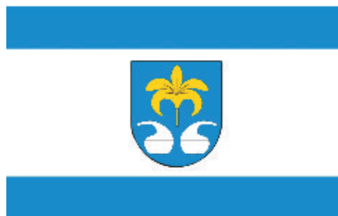
Flaga Miasta i Gminy Nowa Sarzyna