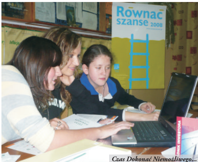
Czas Dokonać Niemożliwego...