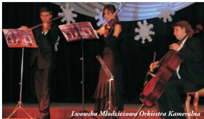
Lwowska Młodzieżowa Orkiestra Kameralna