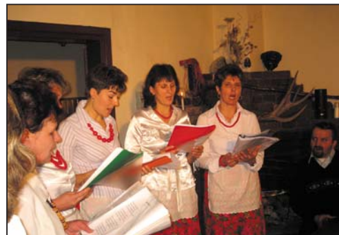
Zespół Gościńczanek na Czwartkowym Podwieczorku