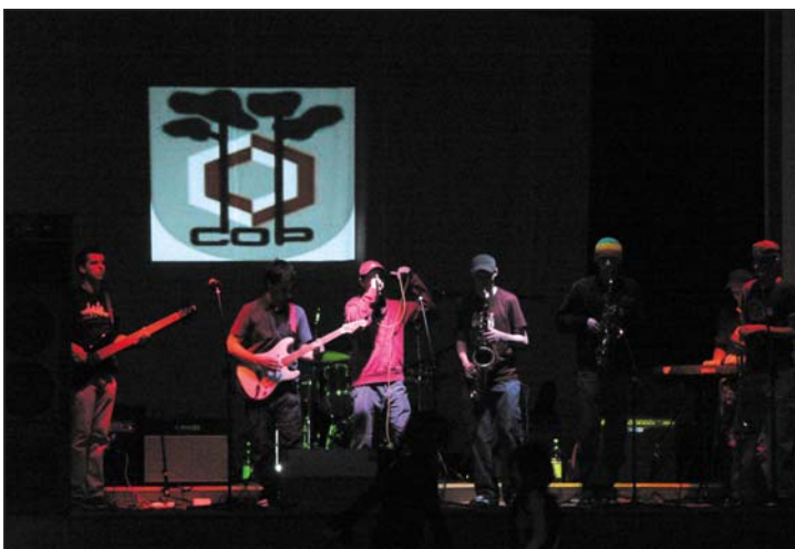
Skafander Faso

Następnie przyszedł kolej na niepisaną gwiazdę wieczoru, czyli Alicetea z Radomia. Niepisaną dlatego, że o ile Project Zion 2 lata temu gościł już w Nowej Sarzynie, tak muzyka Alicetea stanowiła pewną zagadkę i na polskiej scenie reggae stanowi swoiste novum. Grupa ta wytworzyła swój charakterystyczny, oryginalny styl poprzez mieszanie reggae z innymi gatunkami. O tym, że to wszystko daje znakomity efekt przekonała się nowosarzyńska publiczność, która w mgnieniu oka dała się porwać tej niesamowitej scenicznej energii. Wzruszenie ogarniało zebranych, kiedy z ust wokalistów Alicetea popłynął tekst refrenu: "...wiem, dobrze wiem po co tutaj jestem". Słowa jakże aktualne w czasach, kiedy wielu młodych ludzi opuszcza nasze miejscowości, nie mogąc odnaleźć tu swojego miejsca. Tu na V Reggae Andrzejkach przy wspólnej zabawie odnaleźli się młodzi ludzie nie tylko z terenu naszej gminy, ale i z wielu zakątków Podkarpacia, pojawili się także nasi studenci.