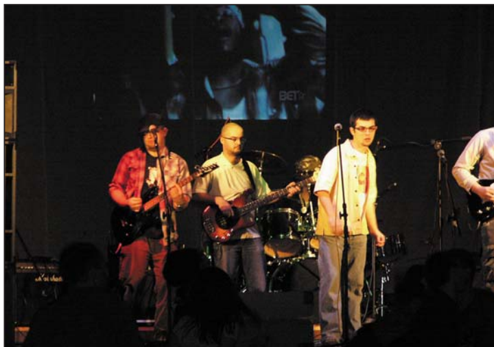
Project Zion

Podczas występu tego zespołu okazało się, że wiek tu nie gra roli, tylko bardzo dobrze ze sobą zgrana ośmioosobowa ska-reggae orkiestra. Grupa Skafander szybko znalazła sobie bogata sekcja dęta i charyzmatyczny wokalista poeznani zostali