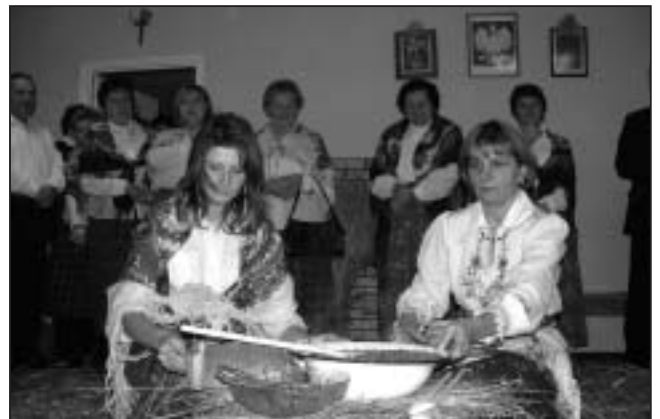
Pierwsze potrawy podane.