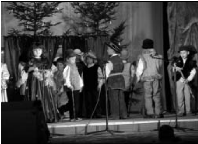
Wychowankowie Przedszkola nr1.