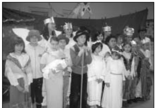
Jasełka w Gościńcu

Na koniec odbył się konkurs kolęd, gdzie mogli wykazać