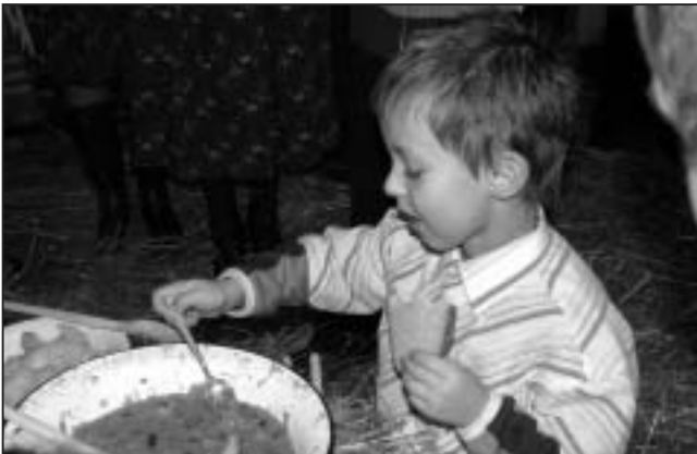
Najmłodszym również dopisywał apetyt.

W pierwszej kolejności goście mogli spróbować kapusty z grzybami i grochem, ziemniaków oraz chleba. Potrawa była tak wyśmienita, że zniknęła w mgnieniu oka. Gospodyni podniosła miskę i oświadczyła "że zbiory kapusty i grochu w nadchodzącym roku będą obfite". Goście wiadomość tą przyjęli brawami.