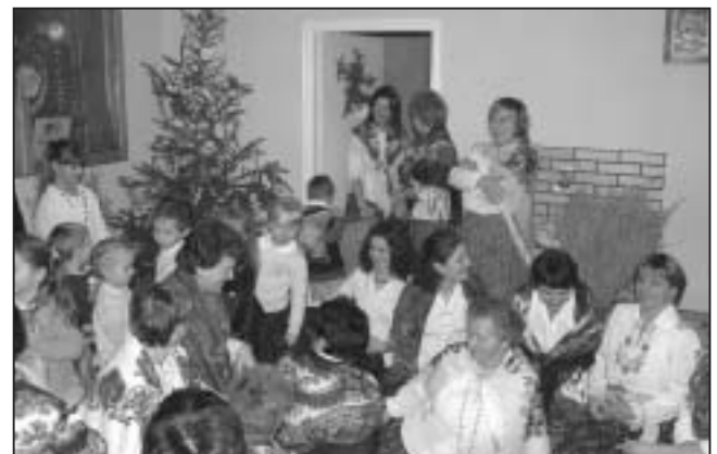
Wspólne kołędowanie.

Na wieczerzy nie mogło zabraknąć Św. Mikołaja. Niestety Mikołaj tego dnia był bardzo zajęty i prezenty dla najmłodszych zostawił pod choinką. Dzieciaki były zachwycone i z prezentami nie rozstawały się na krok. Po pośniku przyszła kolej na wspólne