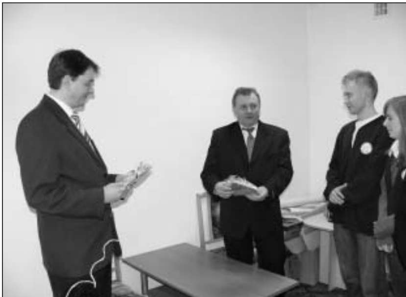
Podziękowania dla z-ców burmistrza za pomoc w akcjach charytatywnych.

Sprzedaż aniołków odbyła się 9 grudnia po każdej Mszy św. pod kościołami w Nowej Sarzynie, Tarnogórze i Jelnej. Do świąt rozprowadzono ozdoby i kartki świąteczne w szkołach i przedszkolach na terenie miasta.