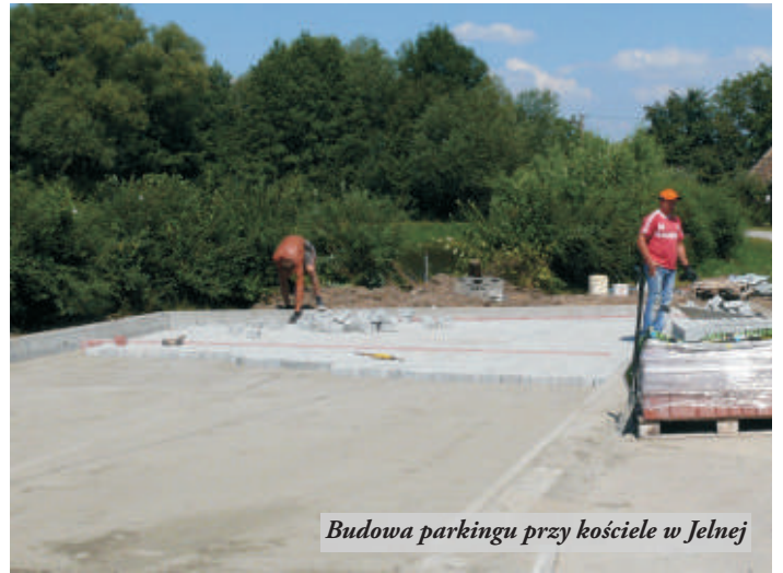
Budowa parkingu przy kościele w Jelnej

Zakończone zostały roboty budowlane w zlewni przepompowni P1 w Łętowni-Gościńcu. Ta, realizowana ze środków unijnych, w ramach Programu Rozwoju Obszarów Wiejskich inwestycja, kosztować będzie ponad 2 mln 154 tys. zł. Dofinansowanie wyniesie 75 % kosztów kwalifikowanych. Do sieci kanalizacyjnej zostanie przyłączonych 60 gospodarstw. Trwa również modernizacja Domu Kultury w Sarzynie, która prowadzona jest także ze środków pozyskanych z PROW. Otrzymaliśmy pozwolenie na budowę stadionu sportowego przy Szkole Podstawowej w Jelnej. Będą tam trzy boiska: do piłki nożnej, siatkówki i koszykówki. Jeżeli chodzi o oświatę, to na ukończeniu jest rozbudowa Zespołu Szkół w Sarzynie. Trwa również budowa nowego skrzydła Gimnazjum w Nowej Sarzynie, której koszt wyniesie 6,7 mln zł. Powstanie 26 sal, w tym 17 pracowni, biblioteka, czytelnia, aula i kompleks żywieniowy dla 300 osób. Prace potrwać do 30 czerwca 2012 r. - poinformował burmistrz Robert Gnatek.