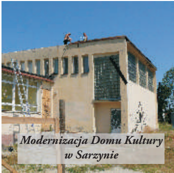
Modernizacja Domu Kultury w Sarzynie