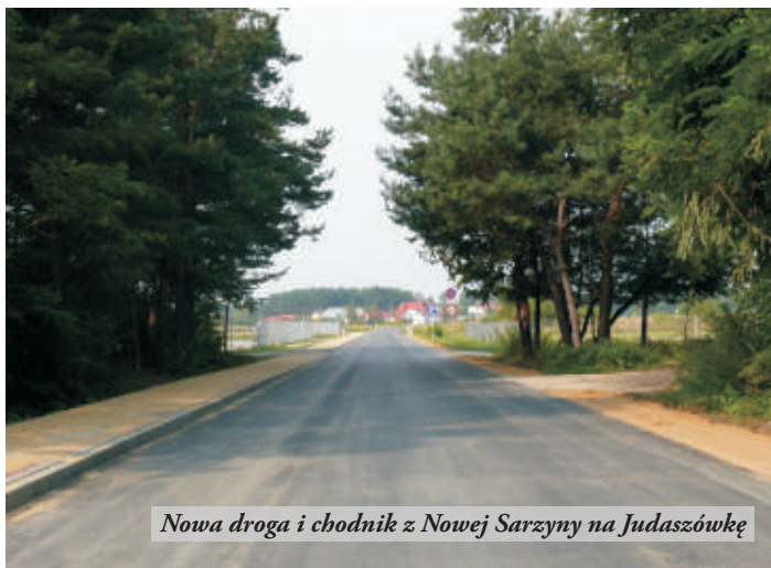
Nowa droga i chodnik z Nowej Sarzyny na Judaszówkę

W sierpniu zakończono budowę nowej nawierzchni asfaltowej