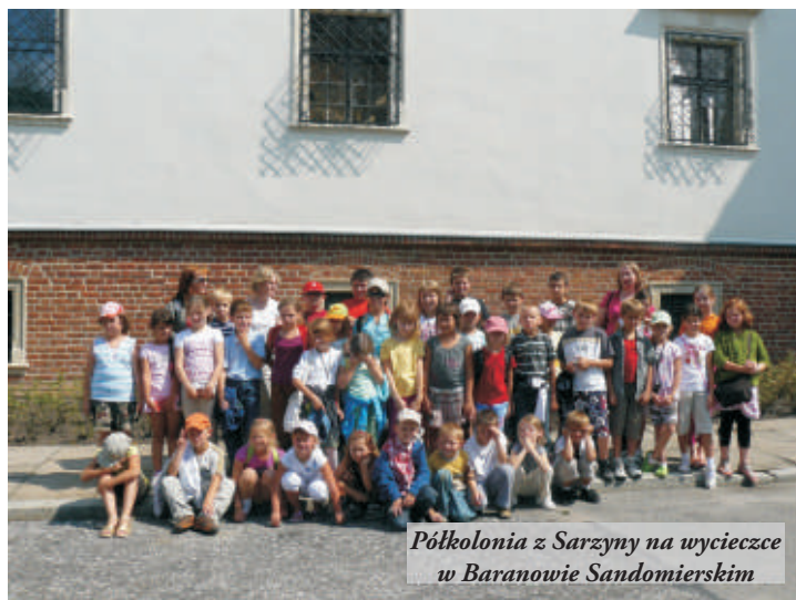
Półkolonia z Sarzyny na wycieczce w Baranowie Sandomierskim

Głównym celem zorganizowanego wypoczynku było zintegrowanie dzieci z różnych środowisk, wyrobienie u nich nawyku aktywnego wypoczynku, rozwinięcie zainteresowań turystyczno-krajoznawczych. Program profilaktyczny miał na celu uodpornienie dzieci na zagrożenia ze strony używek i zapoznać z alternatywnymi sposobami spędzania czasu wolnego oraz zdrowego stylu życia. Kolonia w Zakopanem została zorganizowana ze środków gminnej komisji rozwiązywania problemów alkoholowych, która wsparła także zorganizowanie wypoczynku letniego przez: