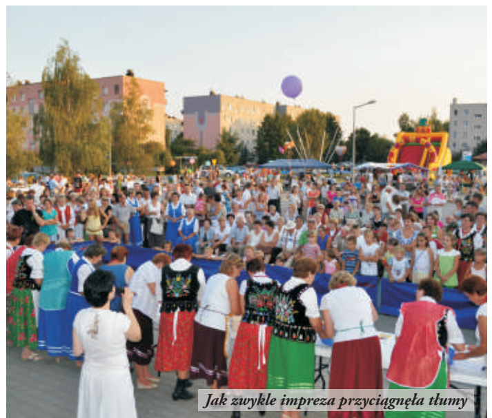
Jak zwykle impreza przyciągnęła tłumy