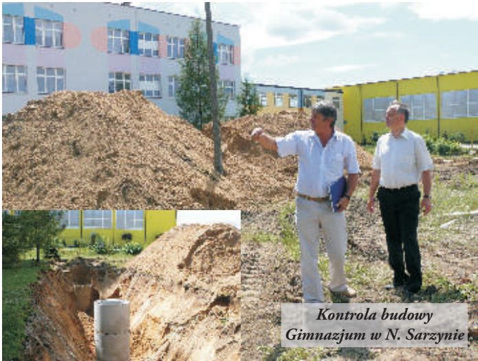
Kontrola budowy Gimnazjum w N. Sarzynie