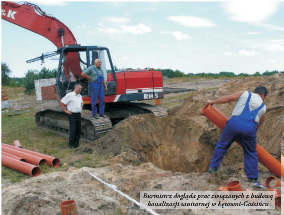
Burmistrz dogląda prac związanych z budową kanalizacji sanitarnej w Łętowni-Gościńcu