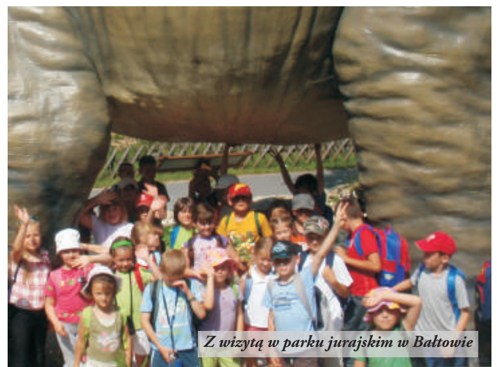
Z wizytą w parku jurajskim w Bałtowie

Szkola została doposażona w nowoczesne pomoce naukowe – 88-calową tablicę interaktywną, komputery przenośne z oprogramowaniem, kolorowe drukarki laserowe, projektory multimedialne. Zajęcia w projekcie “Szkola równych szans” to nie tylko zdobywanie wiedzy teoretycznej, ale również ciekawe wycieczki. I tak uczestnicy zajęć “Z przyrodą za pan brat” odwiedzili Ogród Botaniczny w Boleszycach i Przemysł. Celem wyjazdu uczestników zajęć “Młody ekolog” stał się park jurajski w Bałtowie. Młodzież w ramach zajęć “Przyroda wokół Nas” była z wizytą w Ogrodzie Zoologicznym w Zamościu. Wyjazd pozwolił także na zwiedzenie tego pięknego miasta, które zostało wpisane na Listę Światowego Dziedzictwa UNESCO.