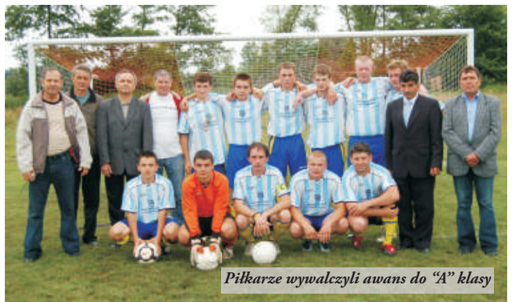
Piłkarze wywalczyli awans do "A" klasy