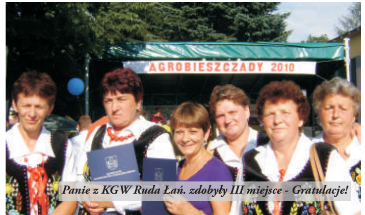
Panie z KGW Ruda Łań. zdobyły III miejsce - Gratulacje!