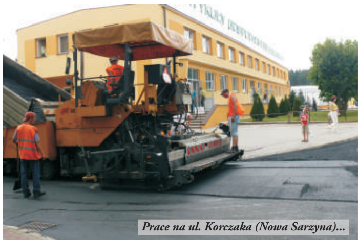
Prace na ul. Korczaka (Nowa Sarzyna)...

Wkrótce rozpocznie się budowa nowej nawierzchni na ulicy Leśnej w Nowej Sarzynie, w Rudzie Łańcuckiej (za remizą) i dwóch dróg w Wólce Łętowskiej (tzw. droga "zagięta" i w kierunku Krzywd). Rozstrzygnięto również przetarg na drugi etap przebudowy drogi do cmentarza w Majdanie Łętowskim. Rozpoczną się także bieżące remonty dróg w Judaszówce i w Jelnej (koło kościoła). Burmistrz przekazał Starostwu dotację na remont dróg powiatowych - 350 tys. zł w Rudzie Łańcuckiej, ponad 22 tys. zł w Łętowni (w kierunku Krzywd) oraz 4 tys. zł na dokumentację projektową chodnika w Majdanie Łętowskim (od skrzyżowania z drogą w kierunku Kuligów do gimnazjum).