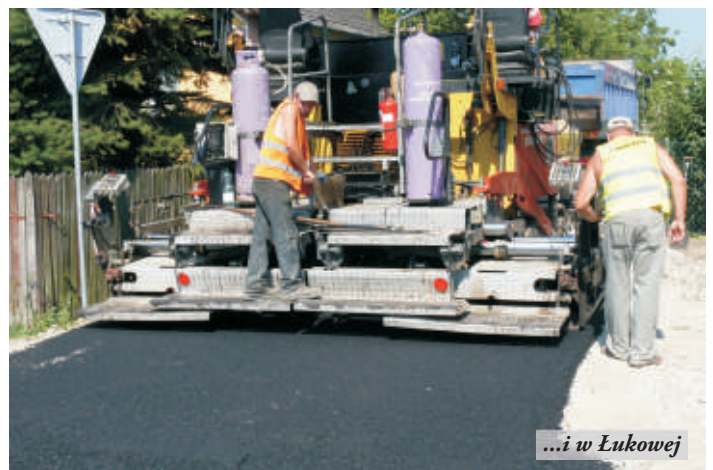
...i w Łukowej