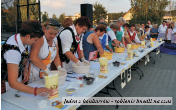
Jeden z konkursów - robienie knedli na czas

skosztować istnych specjałów - chrust, sernik, kapuśniaczki, pierogi ze wszystkimi możliwymi nadzieniami, gołąbki czy smalec i ogórki. Zrobione przez uczestniczki konkursu wafle i knedle były rozdawane wśród publiczności. Z tej imprezy nikt nie wyszedł głodny.